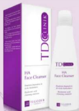
Эмульсия для очищения лица HA Face Cleanser