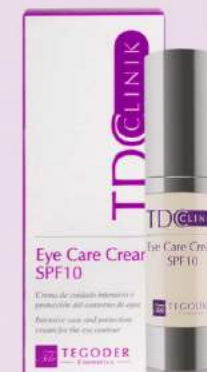
Крем для глаз омолаживающего действия Eye Care Cream SPF 10