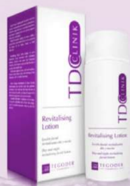
Лосьон эпителизирующий и восстанавливающий Revitalising Lotion