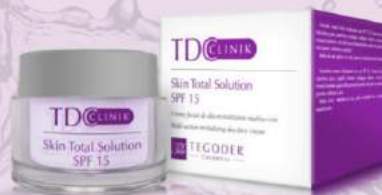
Уход за кожей лица - ежедневный глобальный план действий Skin Total Solution SPF15