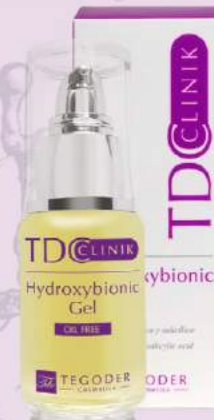
Гель с лактобионовой кислотой Hydroxybionic Gel