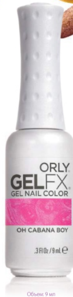
Объем: 9 мл

Модницам понравится широкая палитра гель-маникюра. Ведь в ней представлено свыше 130 популярных оттенков. Провокационно яркие цвета, нежные тона французского маникюра и другие варианты покрытий GELFX позволят воплотить в жизнь самые необычные творческие идеи.